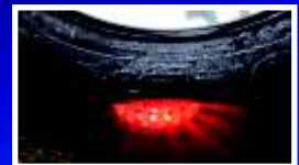
Bruchsicher & belastbar